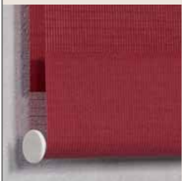
Profilo inferiore interno

Potete scegliere inoltre un profilo inferiore esterno a vista, che garantisce la stessa funzionalità tecnica, ma un impatto visivo più marcato.